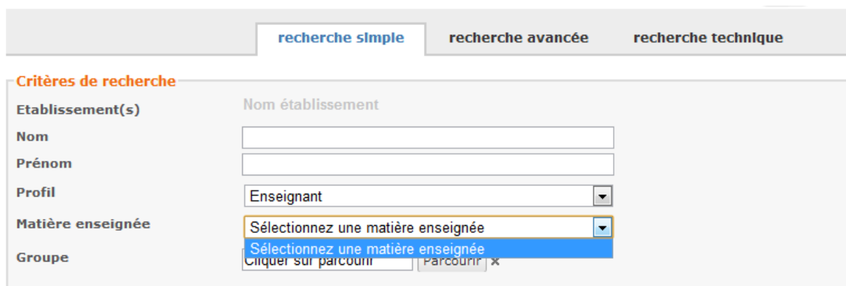
Fig. b1 - Annuaire - Liste des matières enseignées dans la recherche d'un compte de profil enseignant

Cette liste « matière enseignée » est alimentée par l'import des données de l'annuaire fédérateur ou d'un fichier csv. Ainsi pour résoudre cette anomalie, il convient de vérifier la saisie des matières dans STS ou d'ajouter des matières dans le champ correspondant du fichier csv.